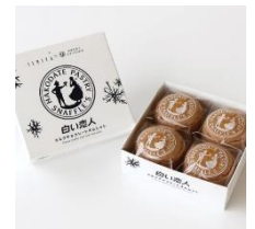
ホワイトチョコレートオムレット ミルクチョコレートオムレット