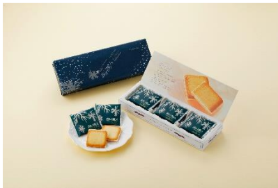
白い恋人(ホワイト)9枚入