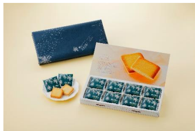
白い恋人(ホワイト)24枚入