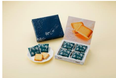
白い恋人(ホワイト)12枚入