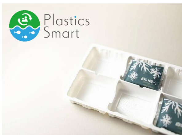
トウモロコシが主原料のバイオマストレー

環境負荷を軽減し、お召し上がりやすく、そして「安心・安全」な商品づくりを意識しております。