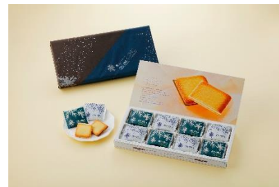
白い恋人(ホワイト&ブラック)24枚入