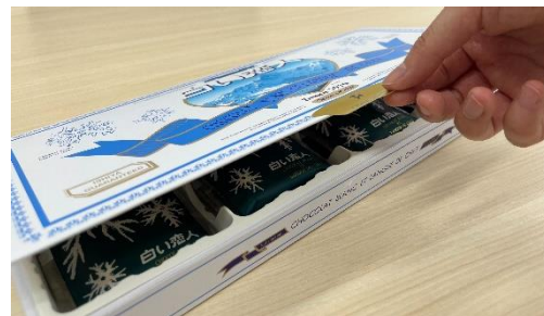
留めシールのつまみの位置を変更することで開けやすくなりました。