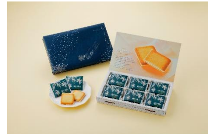
白い恋人(ホワイト)18枚入